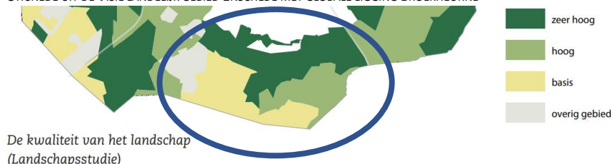
UITSNEDE UIT DE VISIE LANDELIJK GEBIED ENSCHEDE MET GLOBALE LIGGING BROEKHEURNE

Voor landbouw, natuur, landschap, cultuurhistorie, recreatie, landgoederen, water (verdroging), bodem (bodemleven) en lucht (stikstof) gelden de ontwikkelingsprincipes uit de Visie landelijk gebied, de daarin beschreven thematische aanpak en de twintig opgaven voor de uitvoering. De Visie kent onder meer de ontwikkelingsstrategie 'vanuit het landschap ontwikkelen'. De Visie onderscheidt drie kwaliteiten van het landschap (basis, hoog en zeer hoog), die ook alle drie in de Broekheurne voorkomen. Bij elke kwaliteit hoort een strategie om met het landschap om te gaan: inpassen, aanpassen, transformeren.