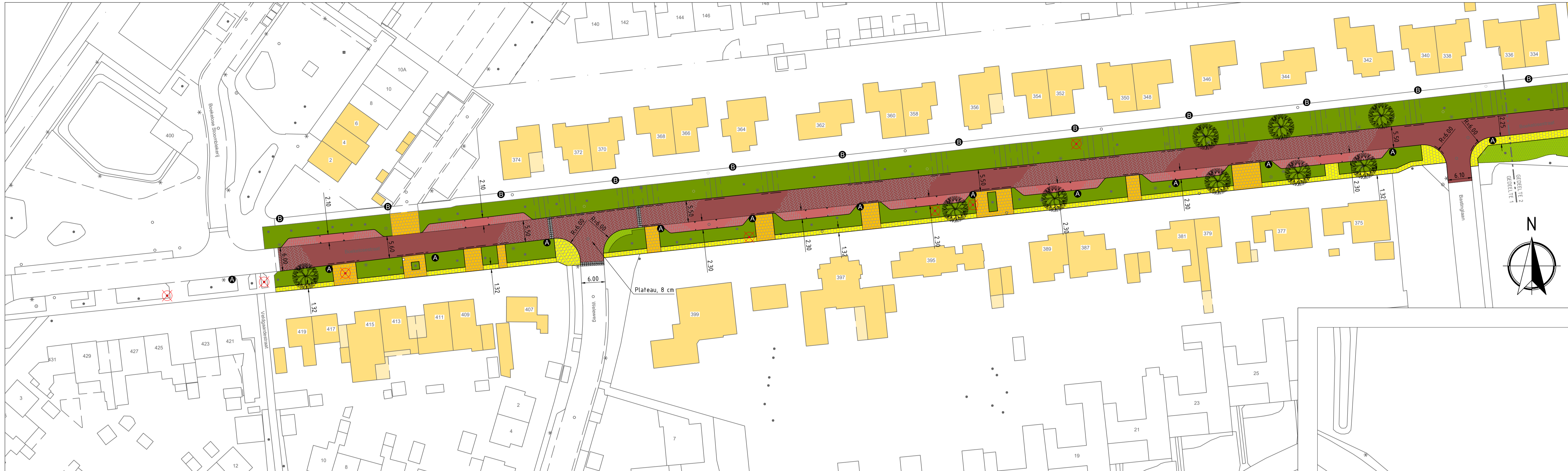
SITUATIE nieuw GEDEELTE 1 schaal 1500