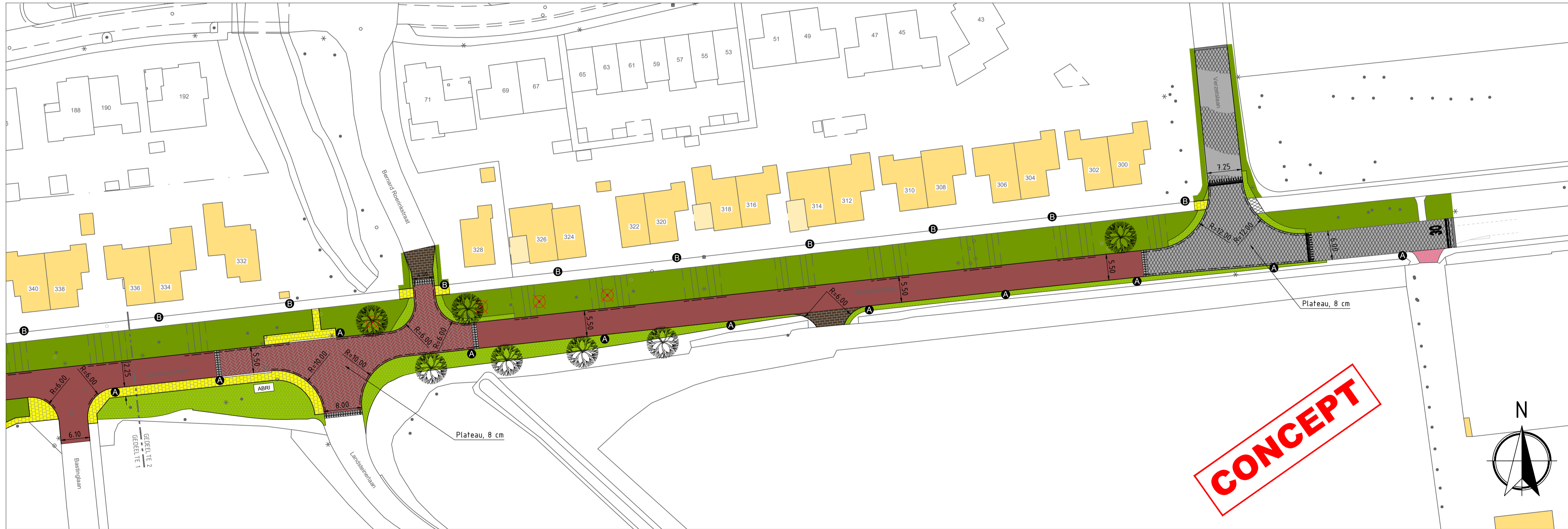
SITUATIE nieuw GEDEELTE 2 schaal 1500