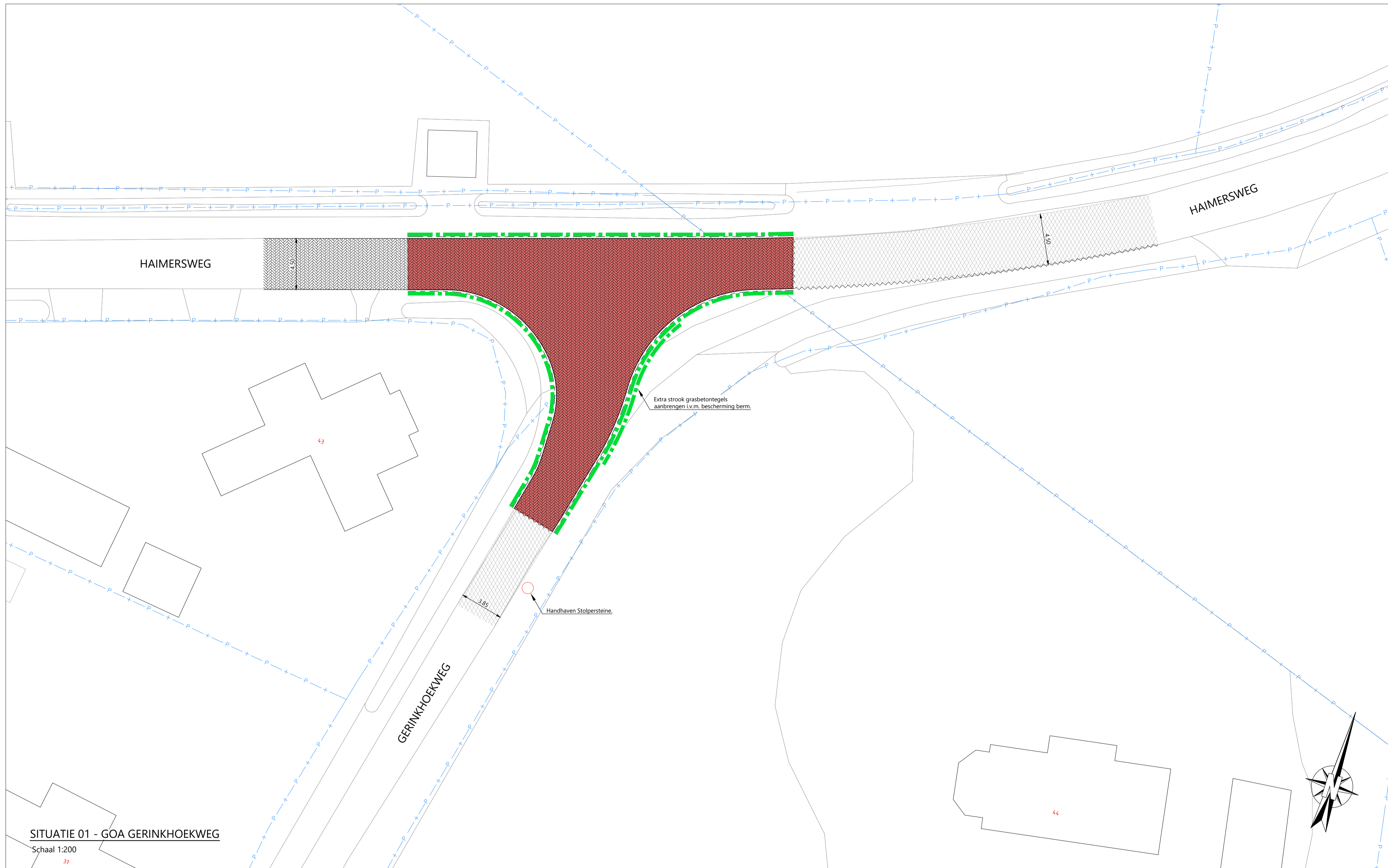
SITUATIE 01 - GOA GERINKHOEKWEG Schaal 1:200