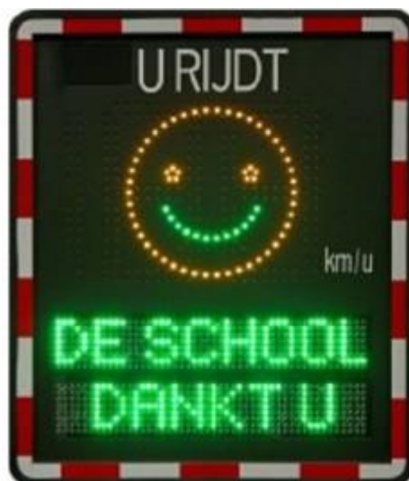
Voorbeeld van een snelheidsmeter

De Elferinksweg en Rembrandtlaan zitten ook in het tracé van de aan te leggen Stadsbeek. Tijdens de aanleg van de Stadsbeek zijn er op het kruispunt Rembrandtlaan-Bruggertstraat ook gelijk snelheidsremmende maatregelen getroffen. Bij de aanleg van de stadsbeek in de Elferinksweg wordt ook gekeken naar de mogelijkheden van het treffen van verkeersmaatregelen.