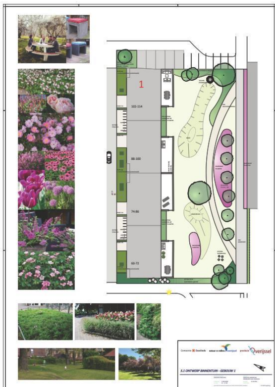
Ontwerp binnenterrein Rembrandtlaan

Dit is in het plan gerealiseerd door toepassing gebruik van duurzame materialen en afkoppeling van regenwater van het dak van de flats. De herinrichting van twee binnenterreinen is in het najaar van 2017 afgerond in combinatie met de aanleg van de Stadsbeek;