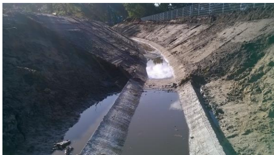
Aanleg Stadsbeek in Bruggertstraat

Een belangrijke maatregel die gericht is op het verminderen van deze overlast is de aanleg van de Stadsbeek. Medio 2017 is begonnen met de aanleg van de 1 e fase in de Bruggertstraat en de Rembrandtlaan.